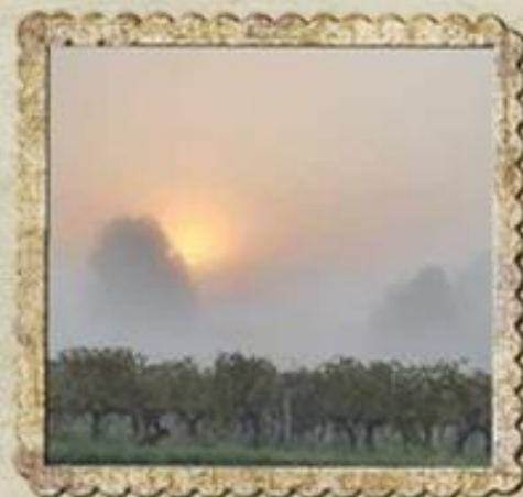
Brume automnale sur le vignoble escoussanais

Madame le Maire d'Escoussans Et le Conseil Municipal Vous souhaitent Une belle et heureuse année 2022